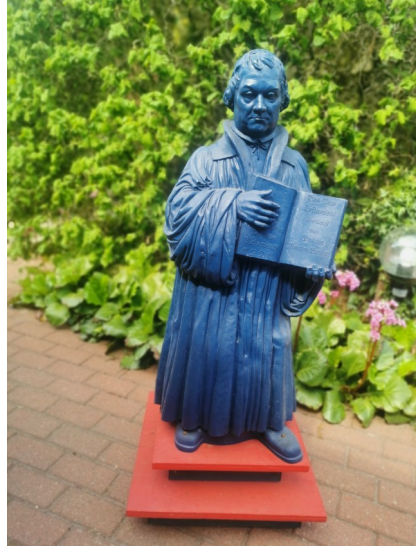
Luther im Garten

und Bagband. Zwei Orte, zwei Lutherfiguren, aber eine gemeinsame Bot-