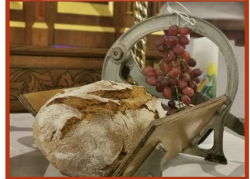
Mit reichlich Ertrag versehenes Erntedankfest