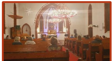
Auch in „Corona-Zeiten“ werden Gottesdienste gefeiert