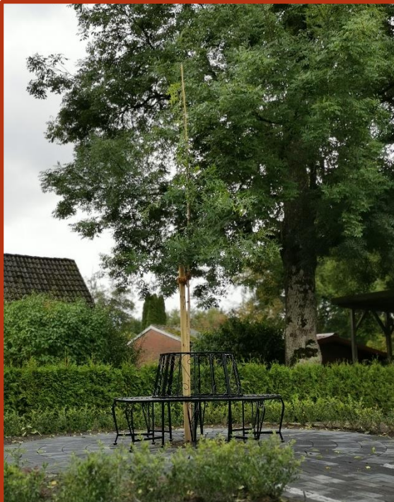
Blick auf die neu angelegte Sitzgelegenheit auf dem Urnenfeld des Friedhofs Ostgroßfehn