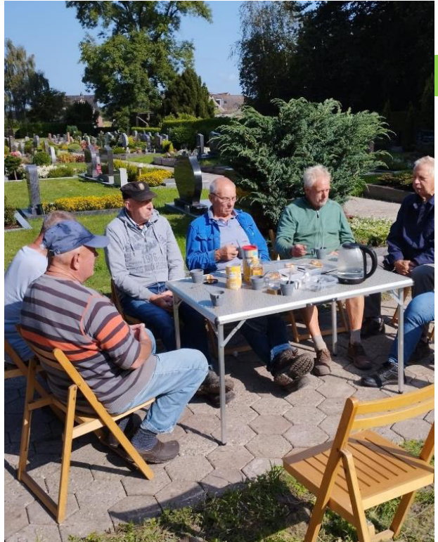
Auch eine Pause ist bei so viel Arbeit wichtig!

Die Pflasterarbeiten sind dank der engagierten ehrenamtlichen Schummeln up Karkhoff Truppe in Eigenregie geleistet und abgeschlossen worden.